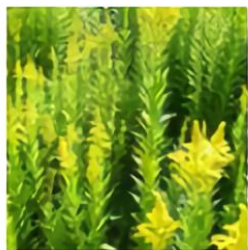
セイタカアワダチソウ